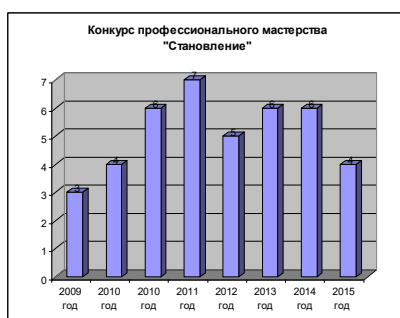
Рис. 1. Участие студентов в профессиональных конкурсах

Оформление иллюстраций. В качестве иллюстраций в работах могут быть представлены чертежи, схемы, диаграммы, рисунки, фотографии и т. п. Иллюстрации могут быть выполнены как в черно-белом, так и в цветном варианте. На все иллюстрации делаются ссылки в работе. Рисунки небольших размеров (1/5 листа), скриншоты (не более 1/2 листа) располагают в тексте непосредственно после того абзаца, в котором данный рисунок был впервые упомянут, или на следующей странице. Рисунок должен располагаться в центре. Иллюстрации должны быть пронумерованы (нумерация должна быть сквозной по всему тексту курсовой или дипломной работы) и иметь наименование, которое помещают под иллюстрацией и форматируют по левому краю. Например: Рис. 1, Рис.2. Интервал между названием рисунка и последующим текстом равен примерно 10 мм.